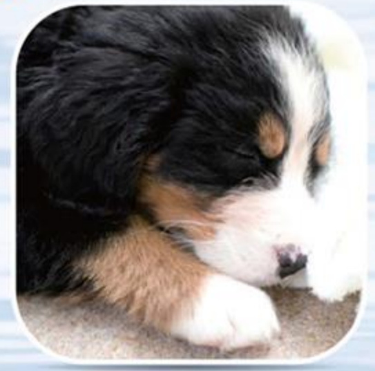
● ใช้กับสัตว์เลี้ยง