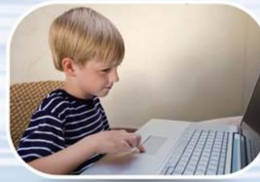
● ห้องอ่านหนังสือเด็ก