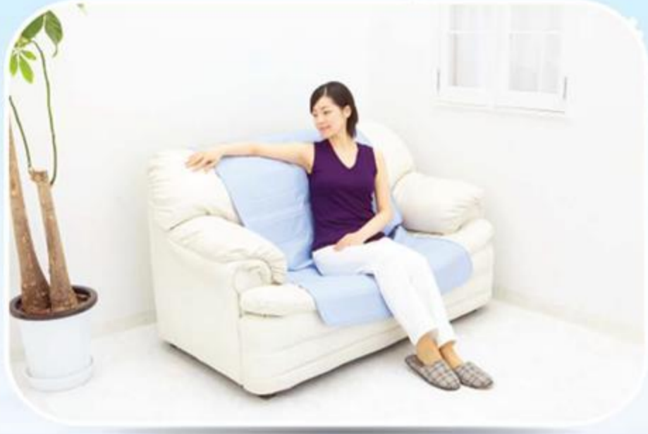
● ห้องนั่งเล่น