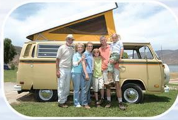
● แคมป์ปิ้ง