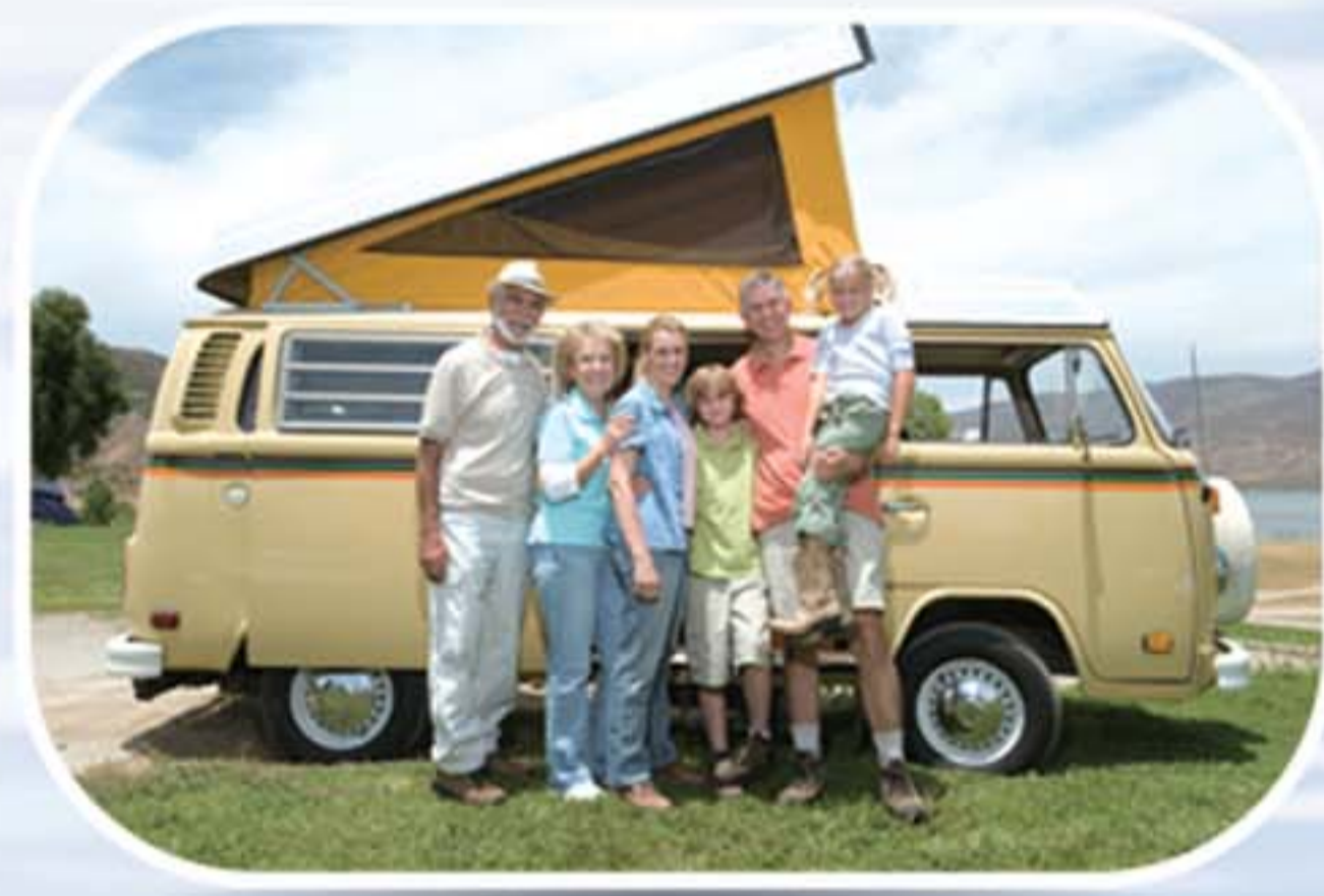
● แคมป์ปิ้ง