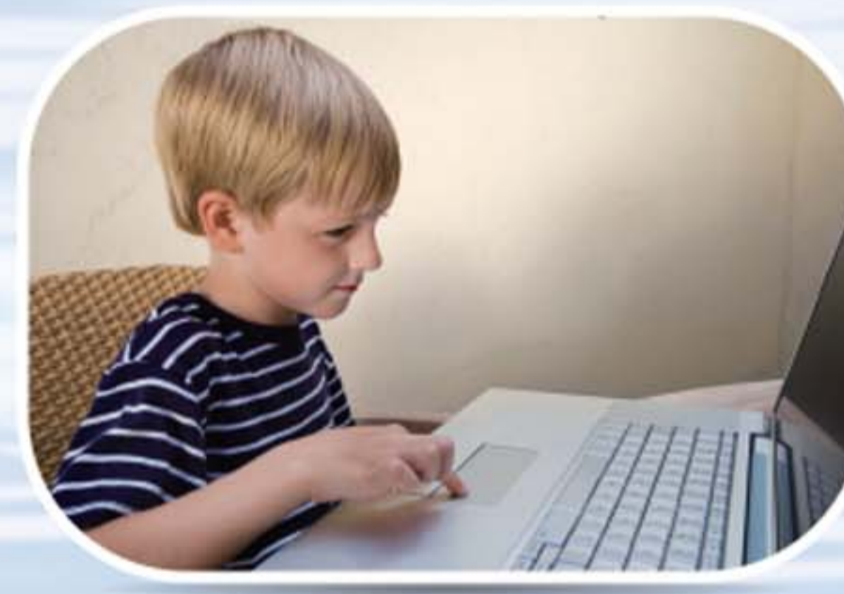
● ห้องอ่านหนังสือเด็ก