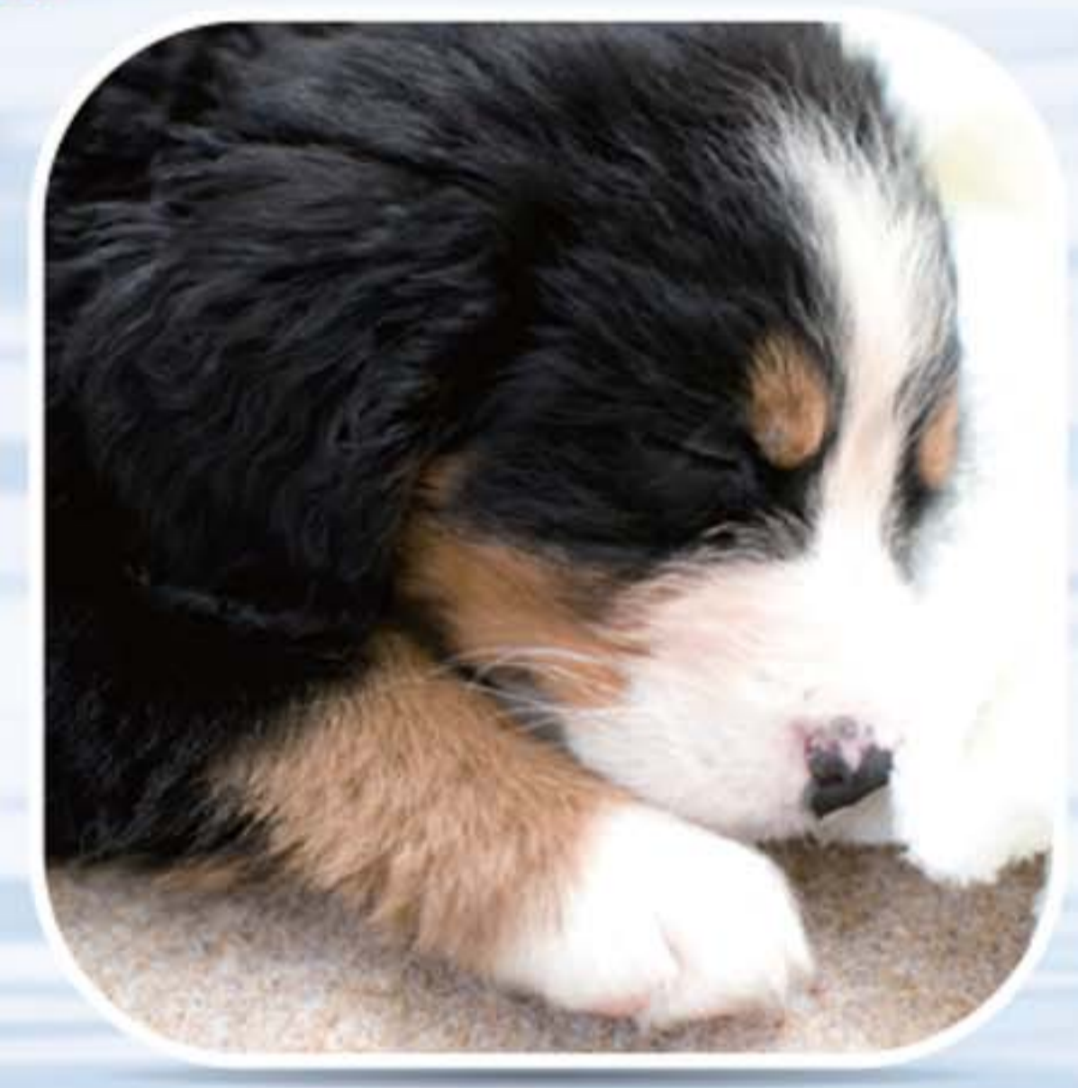
● ใช้กับสัตว์เลี้ยง