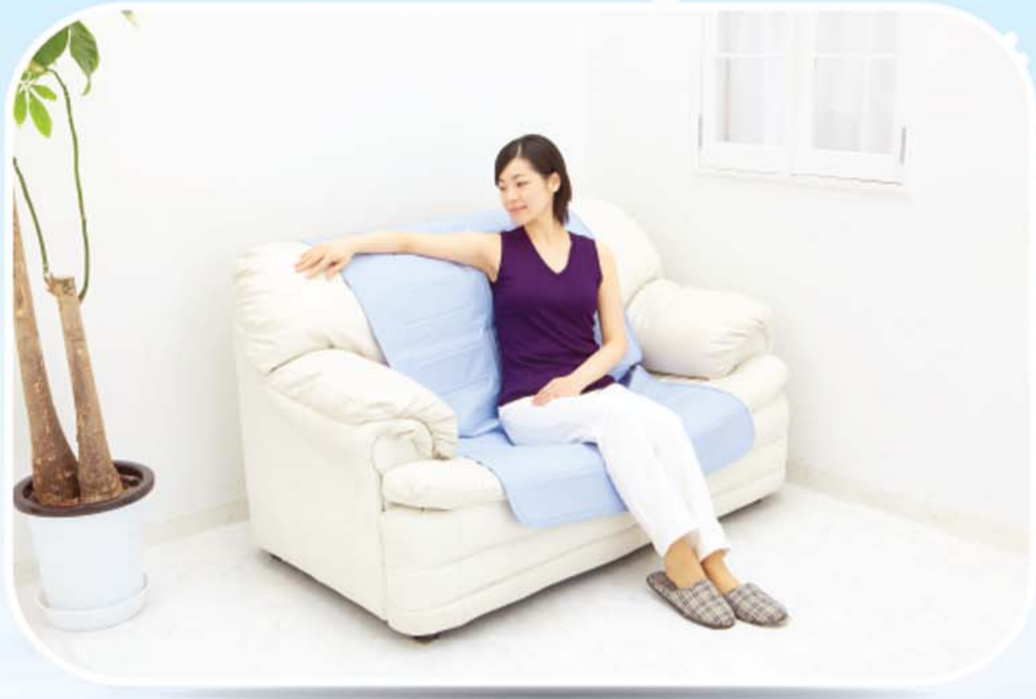
● ห้องนั่งเล่น