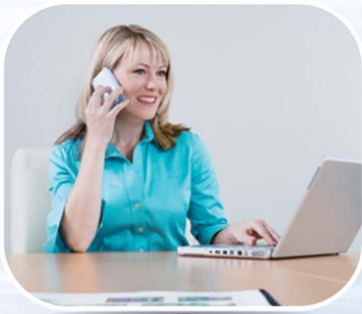
● ห้องทำงาน