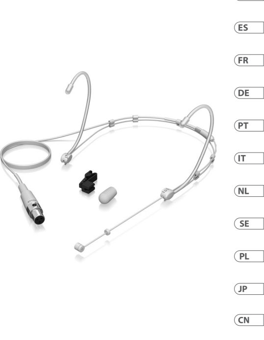
BD440 Premium Neckband Cardioid Microphone