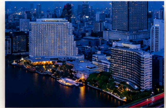
Boarding point: Shangri-La Bangkok's NEXT2 Pier