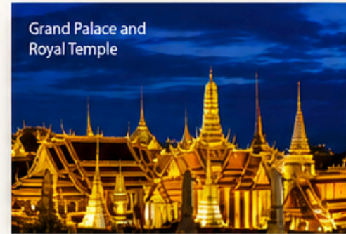
Grand Palace and Royal Temple