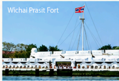
Wichai Prasit Fort