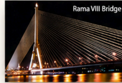
Rama VIII Bridge