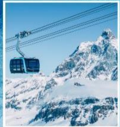
GLACIER PARADISE TOP OF ZERMATT