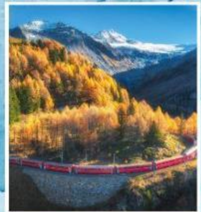
BERNINA EXPRESS Unesco

ออกเดินทาง 22-30 ต.ค. / 31 ต.ค.-08 พ.ย. 69