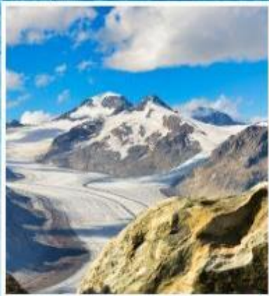
ALETCH GLACIER Riederalp, Bettmeralp