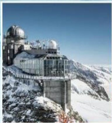
JUNGFRAUJOCH "Top of Europe"