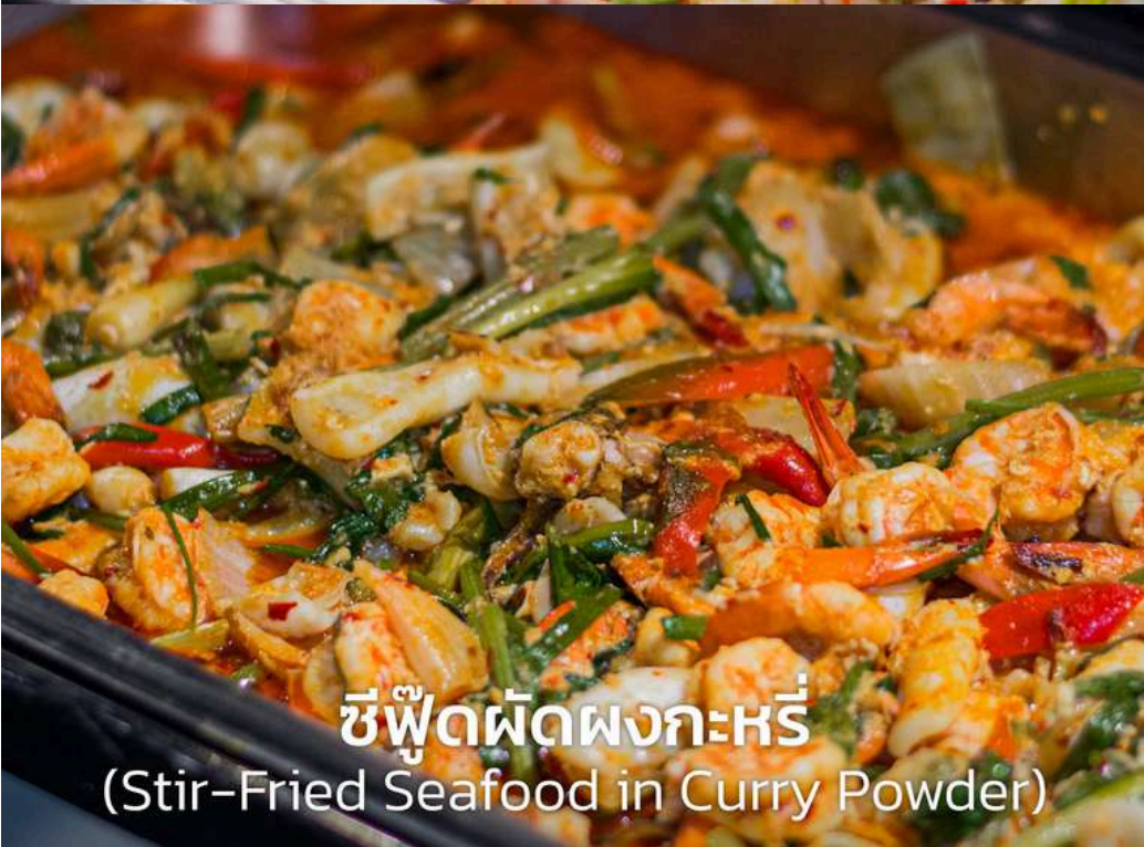
ซีฟู้ดผัดผงกะหรี่ (Stir-Fried Seafood in Curry Powder)