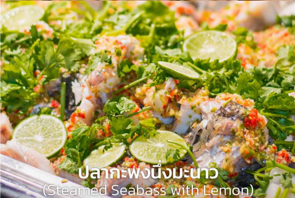
ปลากระพงนึ่งมะนาว (Steamed Seabass with Lemon)