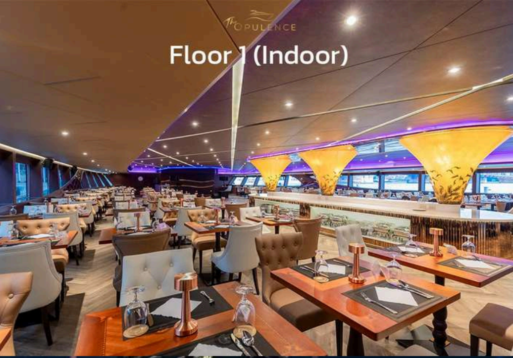
Floor 1 (Indoor)