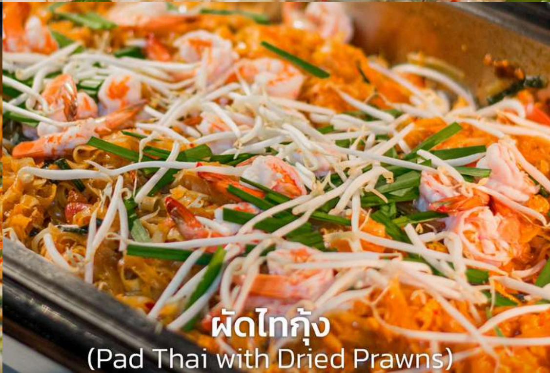
ผัดไทกุ้ง (Pad Thai with Dried Prawns)