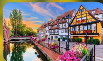
ดินแดนแห่งเทพนิยาย กอลมาร์