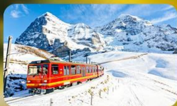
พิชิตยอดเขาจุงเฟรา