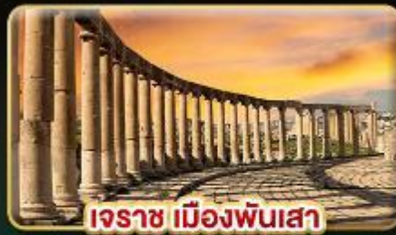
เอราซ เมืองพันเสา