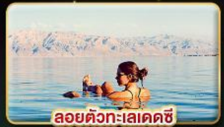
ลอยตัวทะเลเดดซี