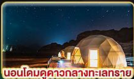
นอนโดมควากลางทะเลทราย

★ บินตรงสู่ "จอร์แดน" เยือน 7 มหัศจรรย์ของโลก