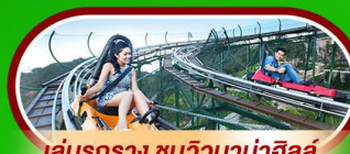
เล่นรถราง ชมวิวบานาฮิลล์

นั่งกระเช้าที่ยาวที่สุดในโลก ขึ้นสู่บานาฮิลล์ ฮอยอัน เมืองมรดกโลกที่สวยงามและเจียบสงบ