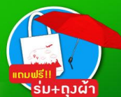
แถมฟรี! รับ+ถุงผ้า