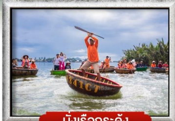
นั้งเรือกระดั่ง