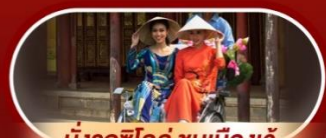
นั่งรถซิคลี่ ชมเมืองเว้