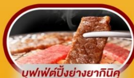
บุฟเฟ่ต์ปิ้งย่างยากินิคุ