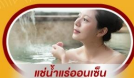
แช่น้ำแร่ร้อนเซ็น