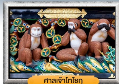
ศาลเจ้าโทโฮกุ

พิเศษฟรี! ซิมโทรศัพท์ 1 ฟอง, แชน้ำแร่ออนเซ็น