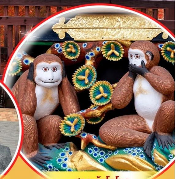
ศาลเจ้าโทโซกุ