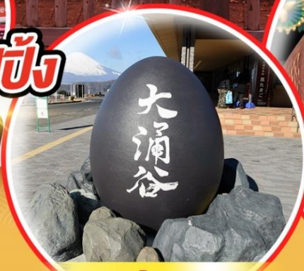
หุบเขาโอวาคุดานิ