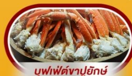
บุฟเฟ่ต์งาปูยักษ์