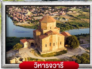
วิหารจวารี