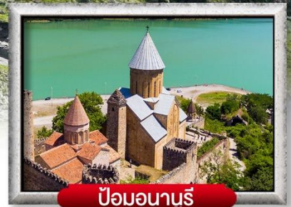
ป้อมอนาบุรี