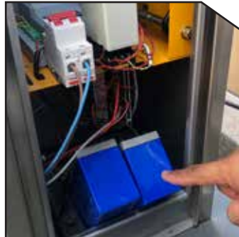
Backup battery keeps barrier running while power off