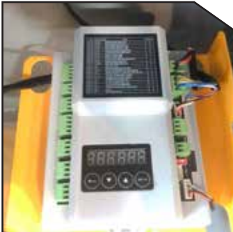
Muti-Function Control System with LED Display