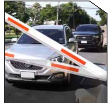
Barrier gate swing out and auto-reverse on obstacle, Protect barrier gate and car.