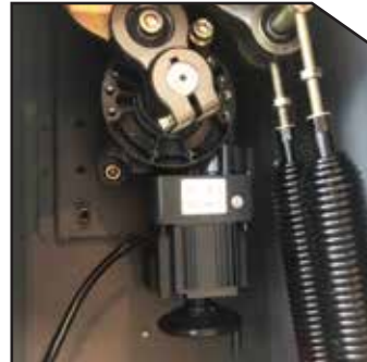
DC Motor 24V DC Motor