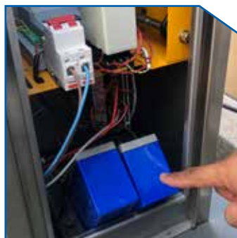
Backup battery keeps barrier running while power off