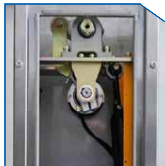
Servo Motor 24V Servo Motor