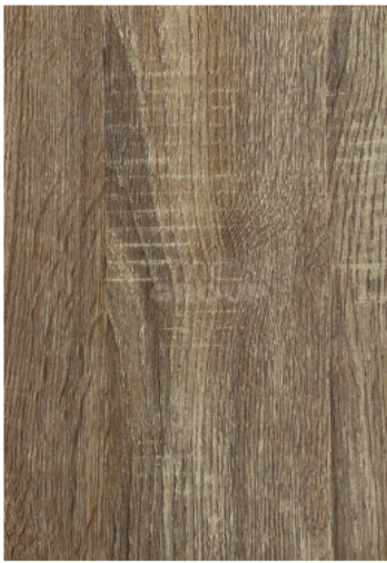
Solid : 939-3 Woodgrain