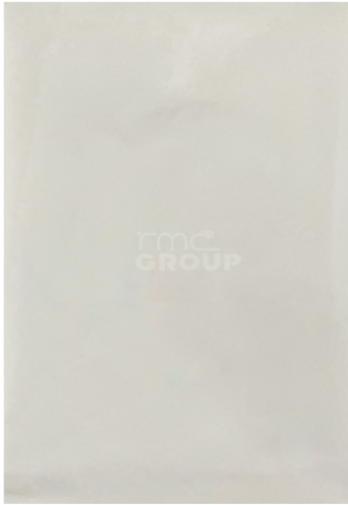
White : 001 Solid Color