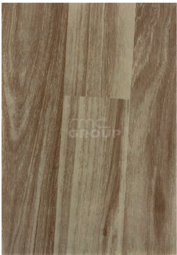
Parquet : 958 Woodgrain