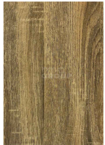
Maple : 939 Woodgrain