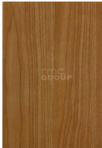
Beech : 912-6 Woodgrain