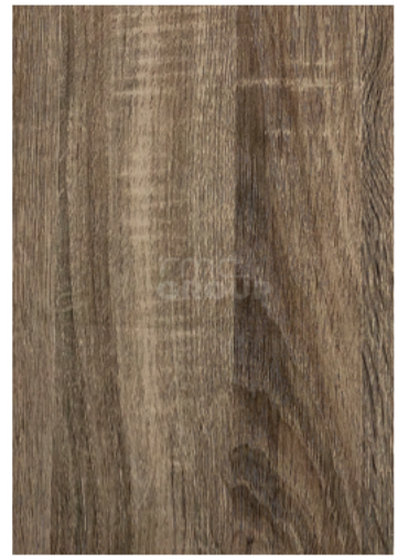
Grey : 939-8 Woodgrain