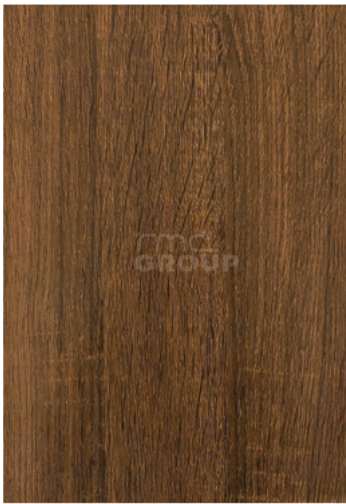
Dark Oak : 939-4 Woodgrain