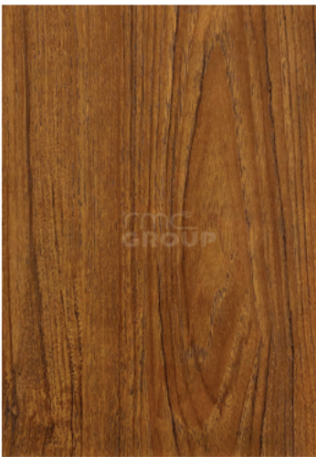
Teak Antique : 966 Woodgrain