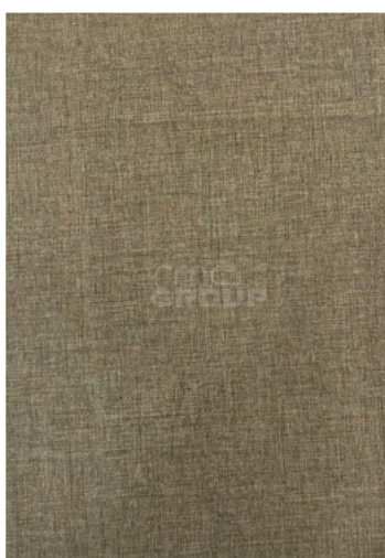
Beige Textile Pattern : 970 Textile