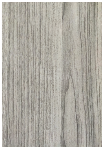
Cherry Gray : 912-8 Woodgrain