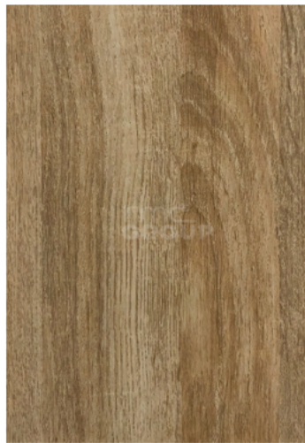
Ash : 939-1 Woodgrain