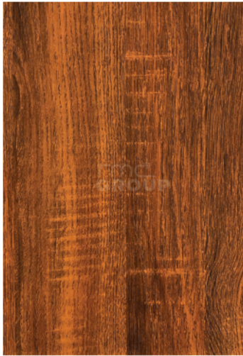
Solid Oak : 939-9 Woodgrain