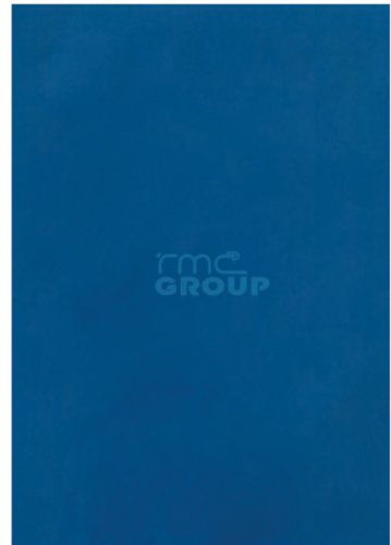
Blue : 203 Solid Color