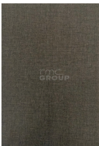
Grey Textile Pattern : 970-1 Textile