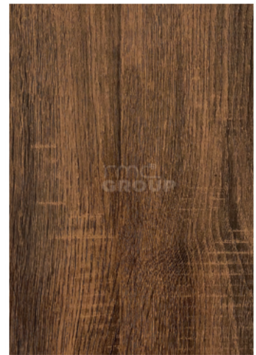
Walnut : 939-5 Woodgrain