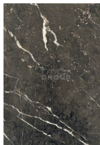
Grey Marble : 973-1 Marble