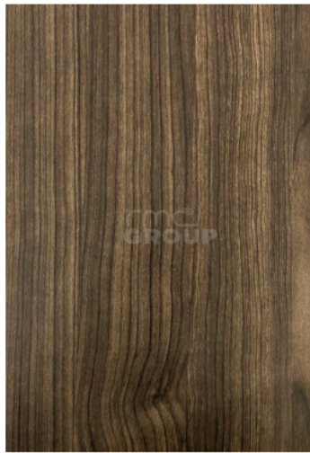
Wenge : 965 Woodgrain