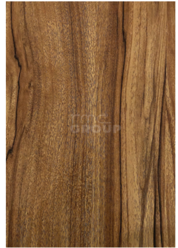
Teak Capu : 974 Woodgrain