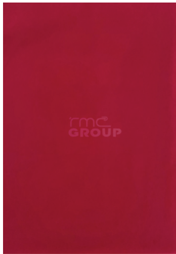
Pink : 109 Solid Color