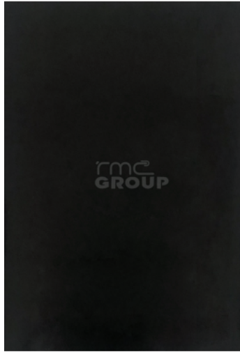
Black : 002-3 Solid Color