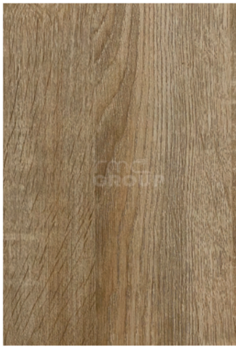
White Oak : 939-2 Woodgrain