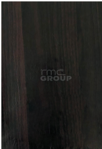
Oak red : 912 Woodgrain