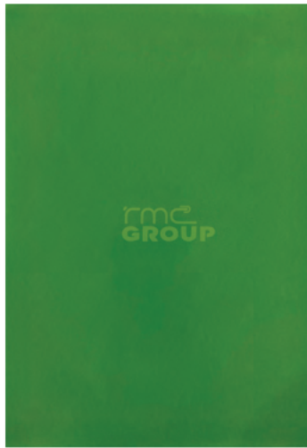
Green : 302 Solid Color