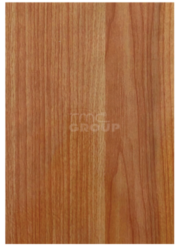
Cherry Brown : 912-9 Woodgrain