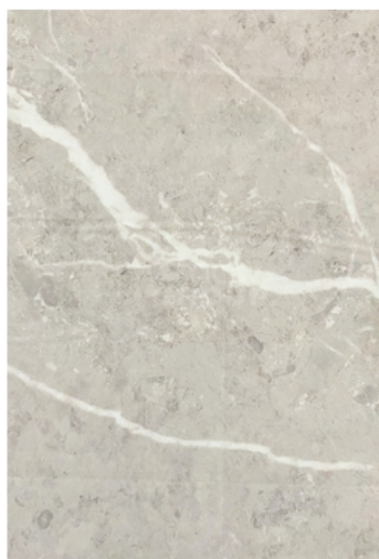
White Marble : 973-3 Marble