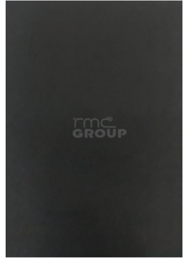
Graphite : 003 Solid Color