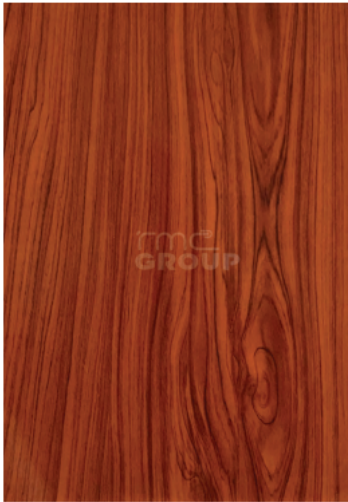
Teak : 914-5 Woodgrain