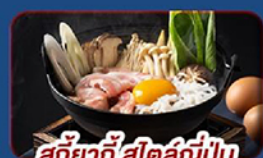
สุกี้ยากี้สไตล์ญี่ปุ่น