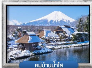
หมู่บ้านน้ำใส