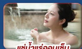
แช่น้ำร้อนเซน