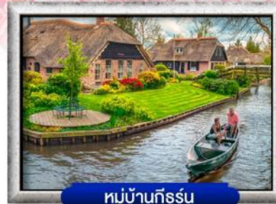
หมู่บ้านทีรูร์น

เมนู พิเศษ! หอยแมลงภู่อบไวน์ขาว, ล่องเรือหลังคากะระจก