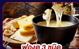
фондิว 3 ชนิด

พิเศษ! พักชอแมท เมือง Car Free • น้ำตกไรน์ • เจนีวา • Unseen เมืองซโตน์ อัม ไรน์