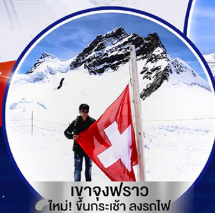
เขาจุงฟราวใหม่! ขึ้นกระเช้า ลงรถไฟ

8 วัน 5 คืน เดินทางตั้งแต่ พ.ค. 65 เป็นต้นไป