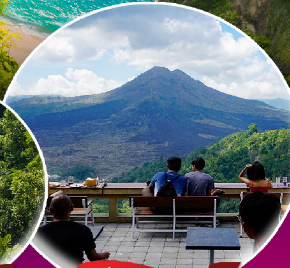
หมู่บ้านคินตามณี