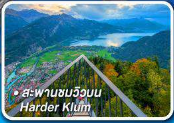
• สะพานชมวิวยอน Harder Klum