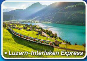
• Luzern-Interlaken Express