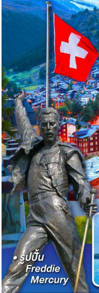
• รูปปั้น Freddie Mercury

พีชิต 5 เชาริทึ, เชาฮาร์เคอ์คุม, เชาจุงเฟรธา เชากาลาเซียร์ 3000 และ เชากรอนเนือร์เกรต