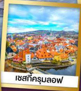
เซสท์ครุมลอฟ