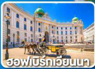
ฮอฟบิรท์เวียนนา