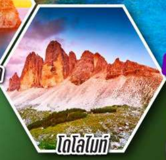
โดโลไมท์