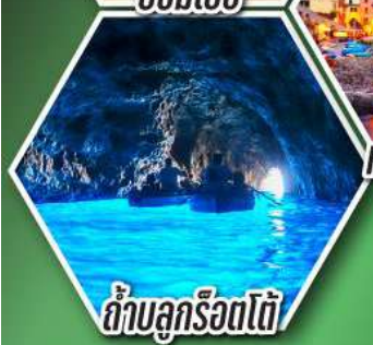
ถ้ำบลูริวด์ไต้