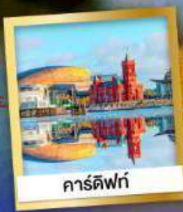
คาร์ดิฟฟ์