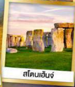
สโตนเฮนจ์