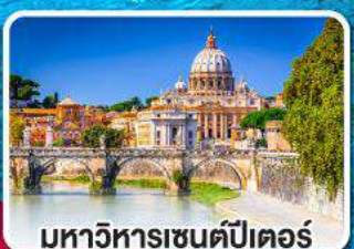
มหาวิหารเซนต์ปีเตอร์