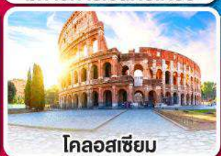
โคลอสเซียม

ลิ้มรสพาสต้า พิชซ่า และสปาเก็ตตี้ แบบต้นตำหรับอิตาลีเลียน