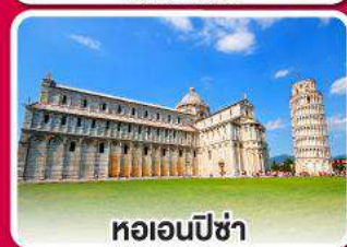
หอเอนปิซ่า