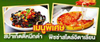
เมนูพิเศษ สปาเกตตีหมักดำ พิชซ่าสไตล์อิตาลี