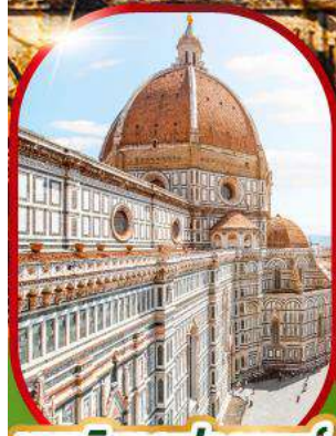
มหาวิหารฟลอเรนซ์