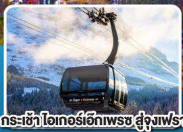
กระเช้าไอเกอร์เอ็กเพรส สู่ยอดเขาจุงเฟรา