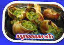
เมนูหอยแอสคาร์โท

ทานอาหาร ณภัตตาคารบนหอไอเฟล พร้อมชมวิวแสนโรแมนติก เมนูหอยแมลงภู่ออเนก