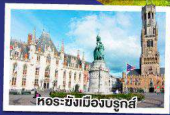
หอระฆังเมืองบรูจส์