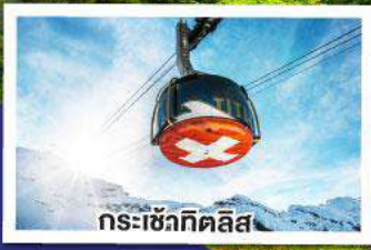
กระเช้าทิตลิส