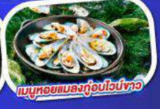
เมนูหอยแมลงภู่ออเนก