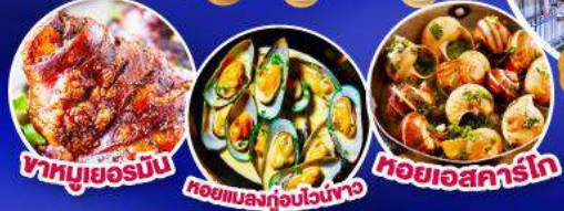
ขาหมูเยอรมัน หอยแมลงภู่อบไวน์ขาว หอยเอสคาร์โท