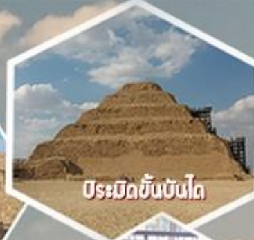
ปิรามิดขั้นบันได