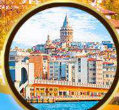
หอคอยกาลาตา