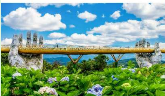
สะพานมือบานาฮิลล์