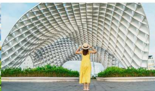
สวนเอเปค