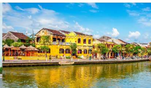
หมู่บ้านฮอยอัน

*กรณีห้องพัkbานาฮิลล์เต็ม ขอสงวนสิทธิ์ในการเปลี่ยนวันเข้าพัก และปรับเปลี่ยนโปรแกรมโดยคำนึงถึงผลประโยชน์ลูกค้าเป็นสำคัญ