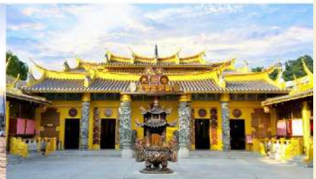
วัดเถาหยวนต้าซีอึ้งฟู่ซ่งจง

*ทางบริษัทฯ ขอสงวนสิทธิ์ในการสลับโปรแกรมทัวร์ตามความเหมาะสมขึ้นอยู่กับสถานการณ์บริษัทฯ โดยคำนึงถึงผลประโยชน์ของลูกค้าเป็นสำคัญ