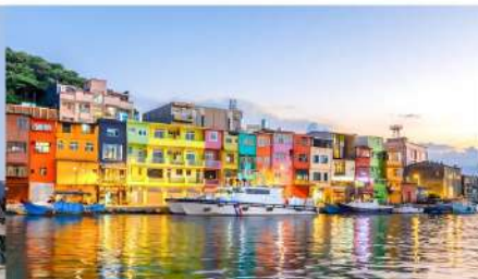
ทำเรือประมงเจิ้งปิ่น