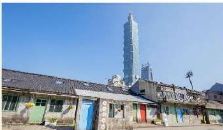
หมู่บ้านชื้อชื้อหนาน