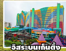
อิสระบนเก็นติ้ง