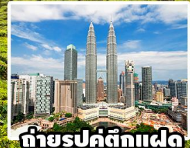
ถ่ายรูปคู่ตึกแฝด