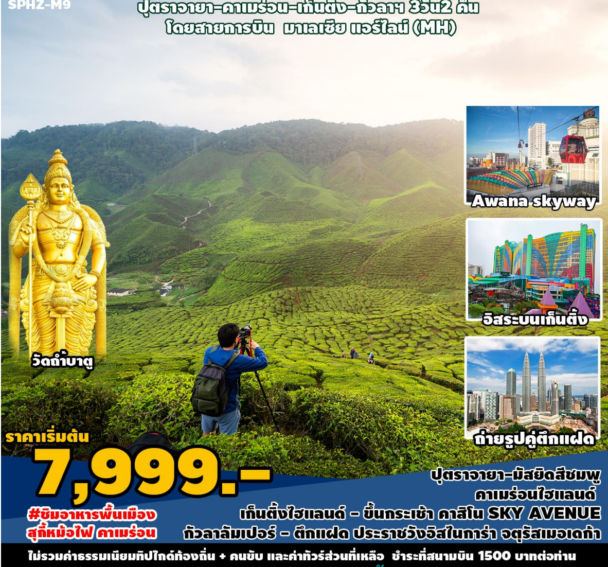
วัดถ้ำบาตู

ปุตรจายา-คามร่อน-เก็นติ้ง-กัวลาฯ 3วัน2 คืน โดยสายการบิน มาเลเซีย แอร์ไลน์ (MH)