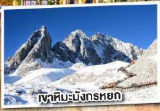
เขาสหิมะมังกรหยก