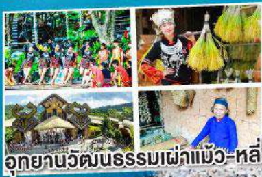
อุทยานวัฒนธรรมเผ่าแม้ว-หลี