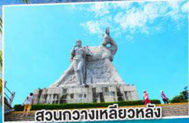
สวนกว้างหลิวหลิง