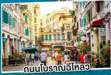
ถนนโบราณอีโหลว