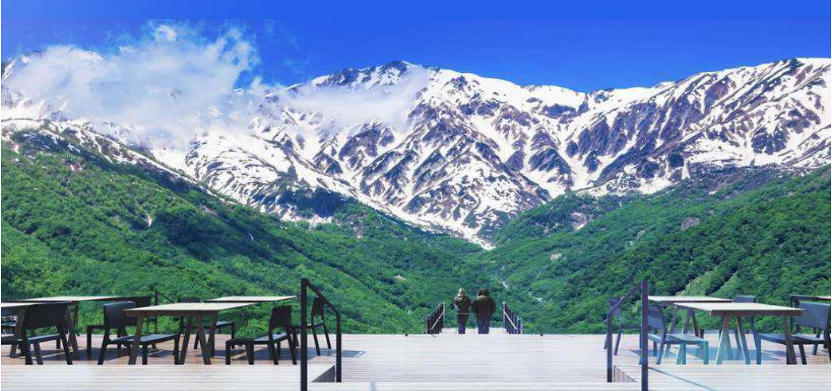
HAKUBA MOUNTAIN HARBOR

ไม่พลาดกับการชมวิวแบบพาโนรามา ณ Hakuba Mountain Harbor ด้วยทัศนียภาพที่เหนือชั้นของภูเขาโดยรอบ จุดเด่น คือ ระเบียง “Hakuba Sanzan” ที่สามารถเห็นเทือกเขาแอลป์แบบ 360 องศา ได้อย่างสวยงามในทุกฤดู สามารถยืนถ่ายรูป และดื่มด่ำกับบรรยากาศได้อย่างเต็มอิม ในบริเวณเดียวกันยังมีร้านเบเกอรี่ โดยทางเข้ามีที่นั่งบนระเบียง สามารถเพลิดเพลินไปกับการจิบเครื่องดื่มอุ่น ๆ พร้อมชมบรรยากาศตามอัธยาศัย