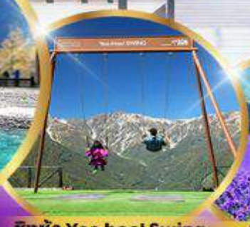
ชิงช้า Yoo hool Swing