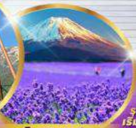
โออิชิ ปาร์ค