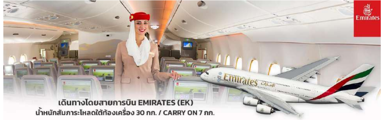
เดินทางโดยสายการบิน EMIRATES (EK) น้ำหนักสัมภาระโหลดใต้ท้องเครื่อง 30 กก. / CARRY ON 7 กก.

** การ์ันตี 15 ท่านออกเดินทาง พร้อมหัวหน้าทัวร์คนไทย **