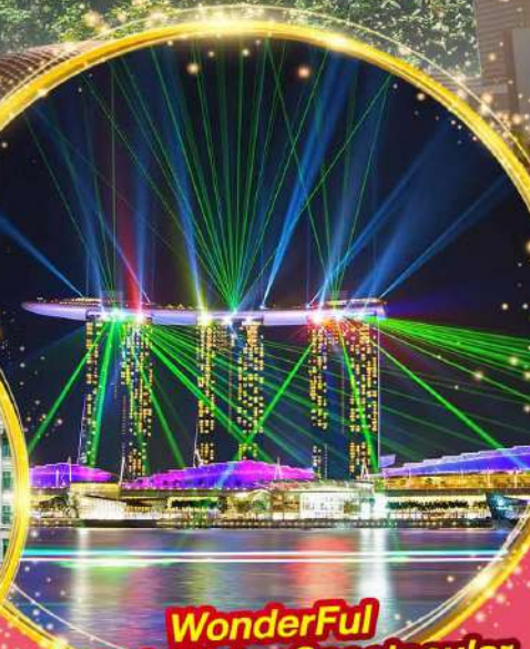
WonderFull Light & Water Spectacular