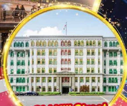
Old Hill Street Police Station