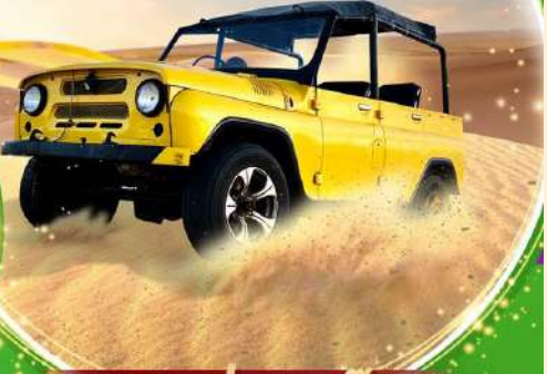
ฟรี!นั่งรถจี๊ป