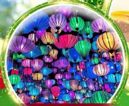
สวนแห่งแสง (Lumiere Light Garden)