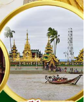
เจดีย์เยลพญา