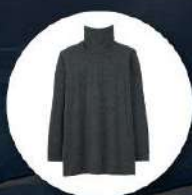
Heattech (ฮัทเทค) แบบหนาพิเศษ ทั้งกางเกงและเสื้อ