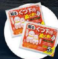
แผ่นความร้อนสำหรับ ให้ความอบอุ่นร่างกาย