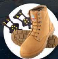
รองเท้าสำหรับเดินบนหิมะ น้ำแข็ง หรือลื่นที่อื่น Ice grippers