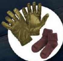
ถุงมือหนาขน ถุงเท้ากันหนาวแบบหนา