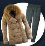
เสื้อและกางเกง กันหนาว, กันลม