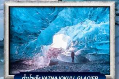
ถ้ำน้ำแข็ง VATNAJOKULL GLACIER

บินทรู สายการบิน Full Service | พิเศษ! ทานอาหารโดมกระจกิว 360 องศา