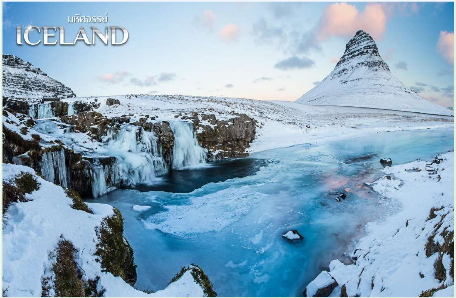
มัลดีจอร์รย์ ICELAND

มุ่งหน้าสู่ เมืองกรุนดาร์ฟจอร์ดูร์ (Grundarfjörður) (ใช้เวลาเดินทางประมาณ 3 ชม.) เพื่อพาชมภูเขาไฟที่โด่งดังที่สุดของไอซ์แลนด์ ภูเขาคีร์กจูเฟล (Kirkjufell) ที่ได้ชื่อว่าเป็นรูปปกของไอซ์แลนด์เลยก็ว่าได้ เป็นฉากหลังของซีรีส์ชื่อดังอย่าง Game Of Throne บริเวณใกล้ๆกันจะมีน้ำตก Kirkjufellsfoss อยู่ เป็นจุดถ่ายรูปที่ต้องไม่พลาดอย่างเด็ดขาด