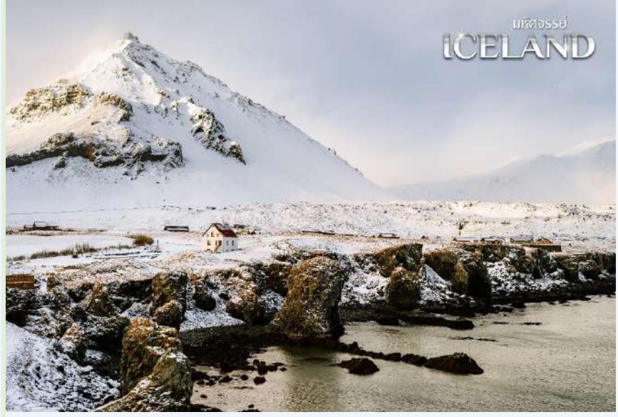
มัลดีจอร์รย์ ICELAND

ผ่านชม คาบสมุทรสไนล์แฟลส์เนสส์ (Snæfellsnes peninsula) ทางฝั่งตะวันตกของเกาะ เต็มไปด้วยธรรมชาติที่ครบถ้วนทั้งน้ำตก ภูเขา ทะเล ที่มีลักษณะไม่เหมือนใครในโลก ตลอดทางท่านจะไม่สามารถห้ลบลงได้อย่างแน่นอน