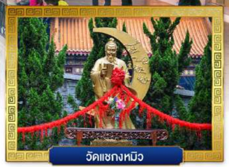
วัดเซกหมิว