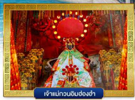
เจ้าแม่กวนอิมฮองฮำ