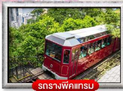
รถรางพิกแครม