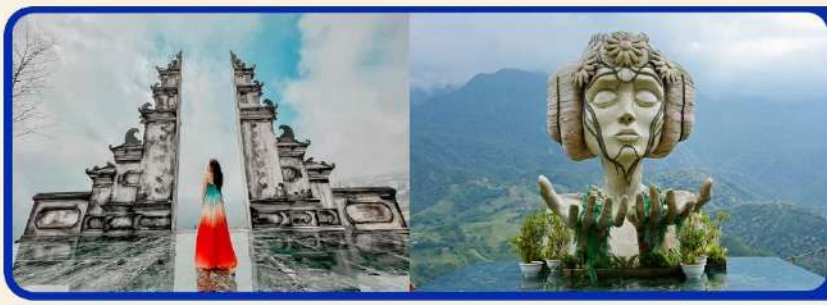
เช็คอิน โมอาน่า (Moana Sapa Cafe)