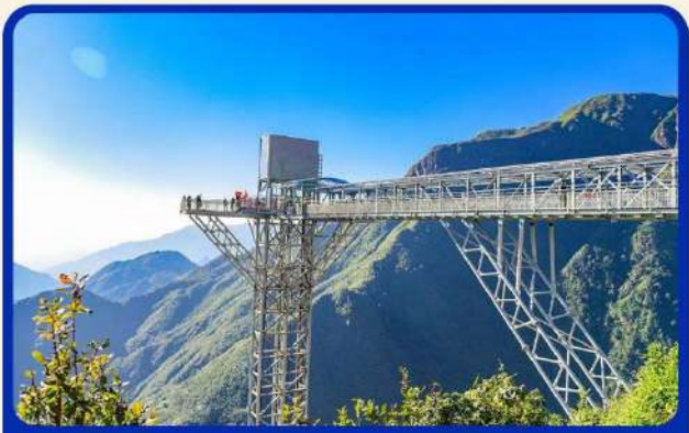
สะพานแก้วมังกรเมฆ (Rong May Glass Bridge)