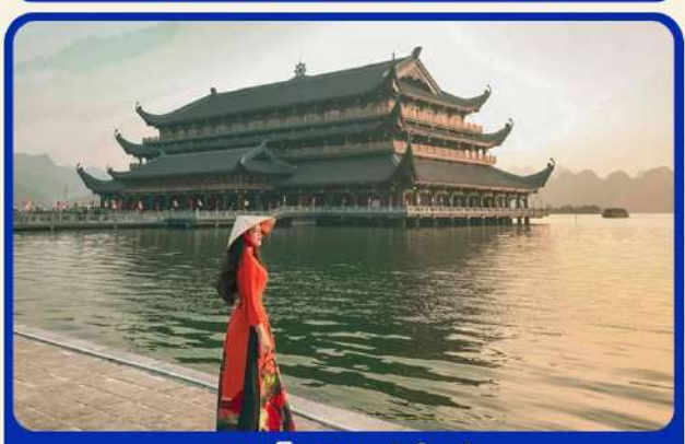
จุดเช็คอินแห่งใหม่ "วัดตามจุก"