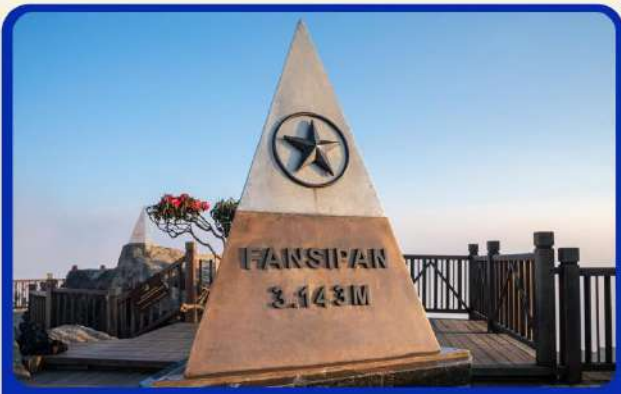
น้ิงกระเช้าสู่ยอดเขาฟานซิปัน