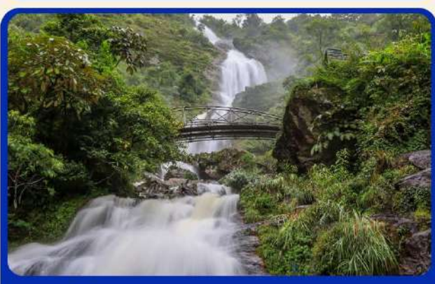
น้ำตกสีเงิน (Silver Water Fall )