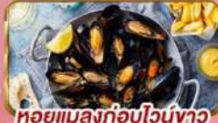
หอยแมลงภู่อบไวน์ขาว