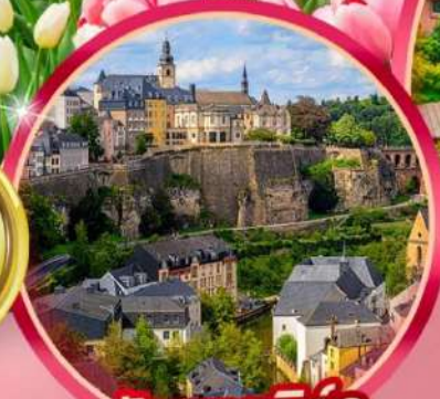
ลิกเซมเบิร์ก