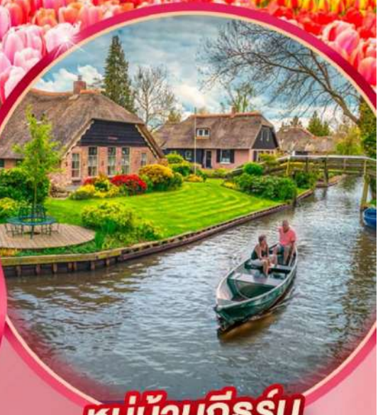
หมู่บ้านทีฮอร์ส