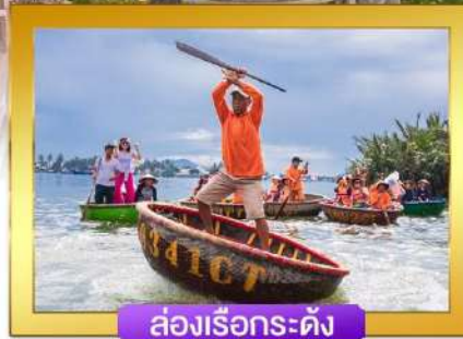
ล่องเรือกระด้ง