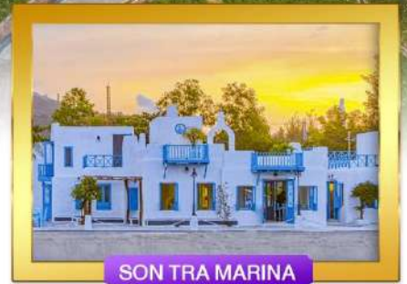
SON TRA MARINA