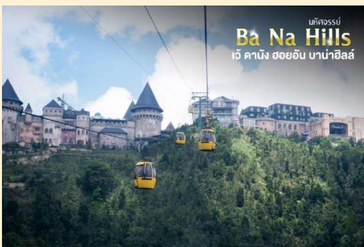
มหิตจรรย์ Ba Na Hills เว้ คานิง ฮอยอัน บานาฮิลล์

กระเช้าแห่งบานาฮิลล์นี้ได้รับการบันทึกสถิติโลกโดยWorld Record ว่าเป็นกระเช้าไฟฟ้าที่ยาวที่สุดประเภท Non Stop โดยไม่หยุดแะมีความยาวทั้งสิ้น 5,042 เมตรและเป็นกระเช้าที่สูงที่สุดที่ 1,294 เมตรนักท่องเที่ยวจะได้สัมผัสปุยมะหมอกและบางจุดมี