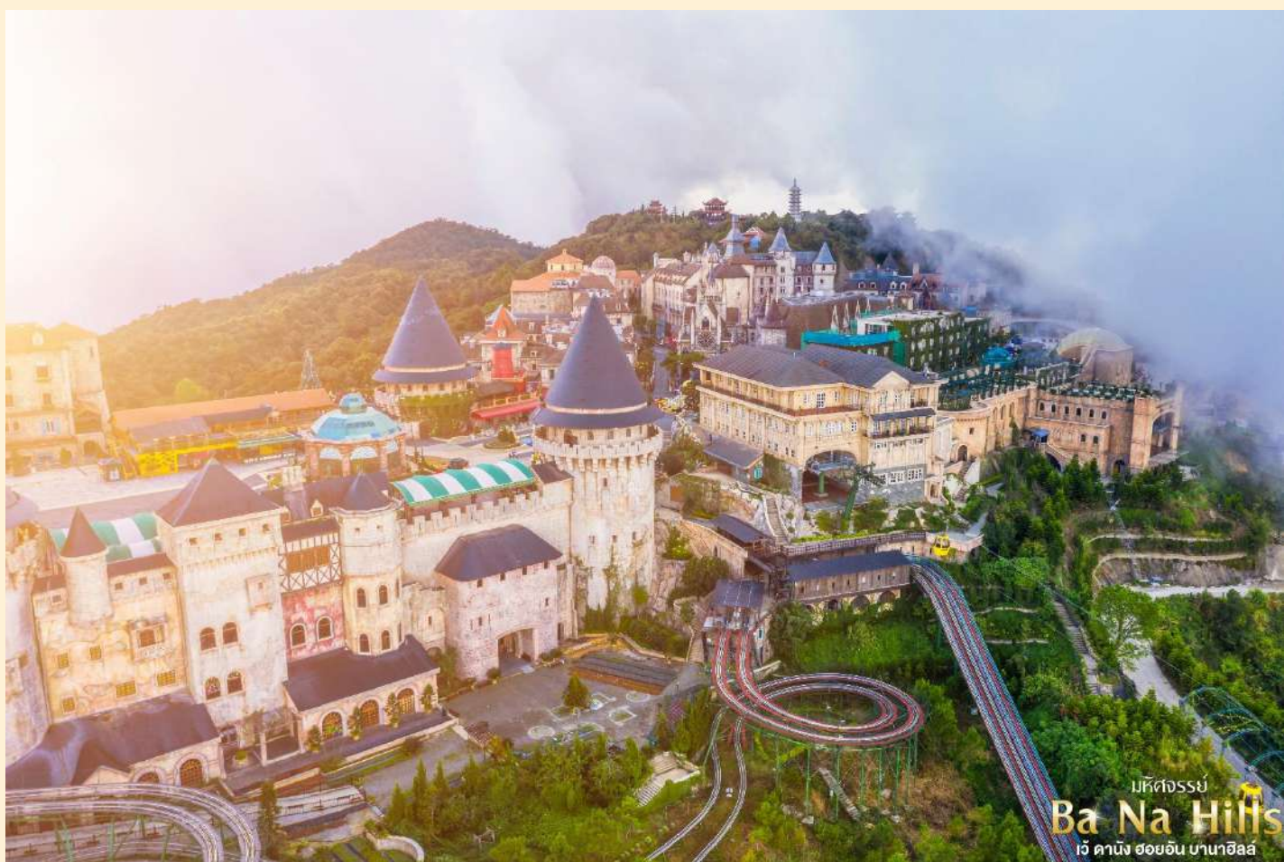
มหิตจรรย์ Ba Na Hills เว้ คานิง ฮอยอัน บานาฮิลล์