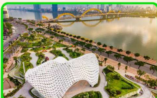
เช็คอิน แหล่งที่เที่ยวยุคใหม่ APEC PARK