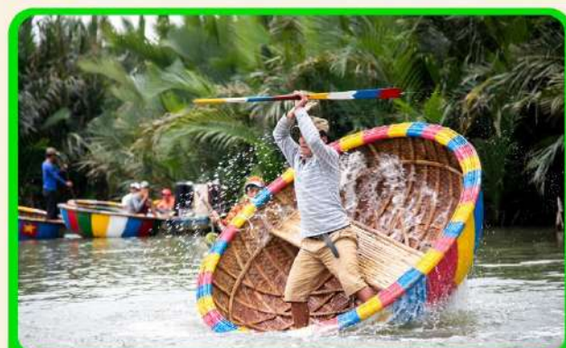
พิเศษ !!! นั่งเรือกระดัง UNSEEN เวียดนาม