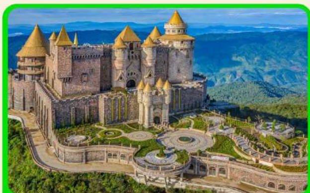
เที่ยวบานาฮิลล์แบบจุใจ เต็มวัน